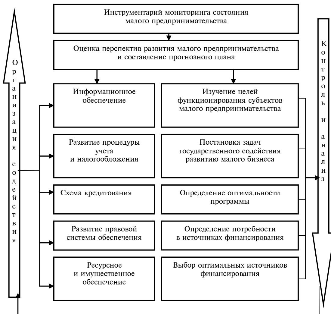
Ðèñ. 4. Блок-схема системного подхода к формированию государственной поддержки малого предпринимательства в сфере услуг

ров по направлениям регулирования и ресурсы, необходимые для реализации поставленных на федеральном, региональном и местном уровнях целей и задач.