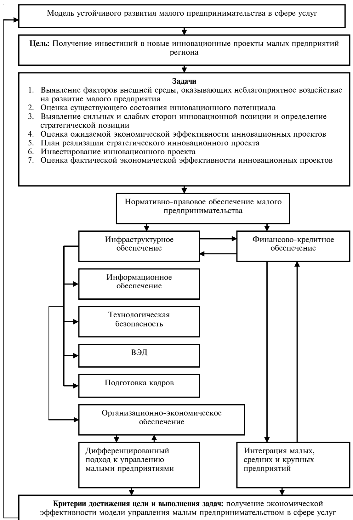
Рει. 3. Модель устойчивого развития малого предпринимательства в сфере услуг

стояние малого предпринимательства на конкретную дату за анализируемый период, а также аналитических материалов. Это позволит взаи-