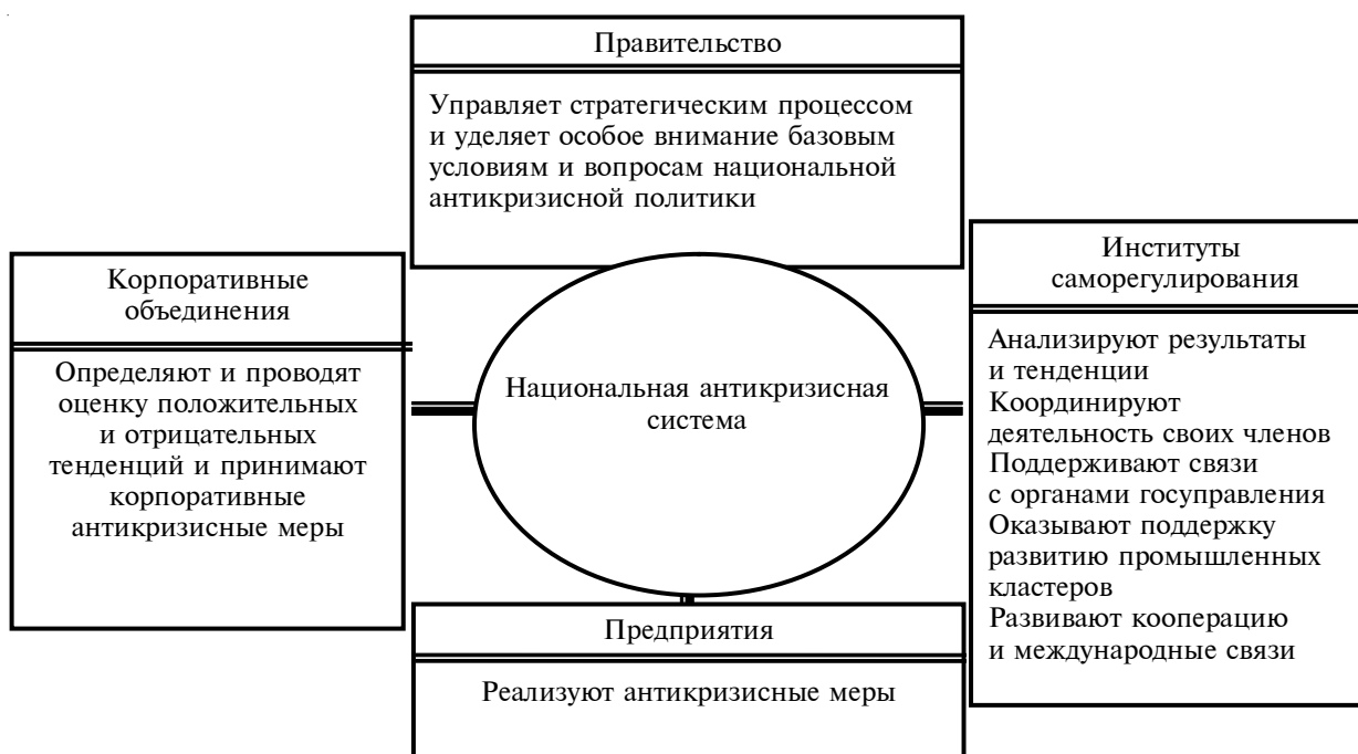
Рис. 3. Участники национальной антикризисной системы

Как следует из представленной схемы, ключевые сегменты национальной антикризисной системы (Правительство, Корпоративные объе-