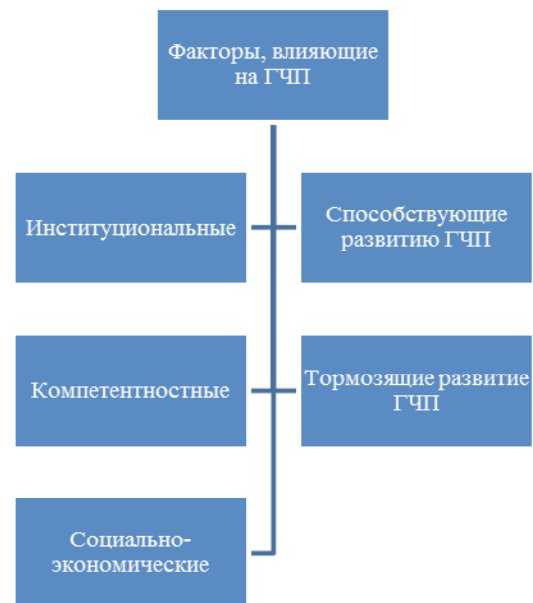
Рис. 2. Факторы, влияющие на развитие ГЧП

На основе проведенного анализа современной мировой и отечественной экономической литературы авторами выделены следующие факторы, определяющие развитие государственно-частного партнерства (рис. 2).