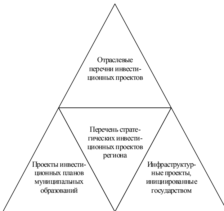
Рис. 2. Конфигурация инвестиционной программы субъекта федерации

ния комплексной инвестиционной программы субъекта федерации представлены на рис. 2.