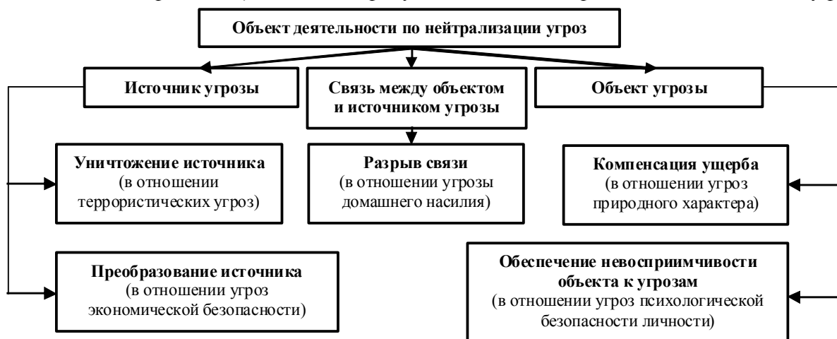
Рис. 3. Типология подходов к нейтрализации угроз