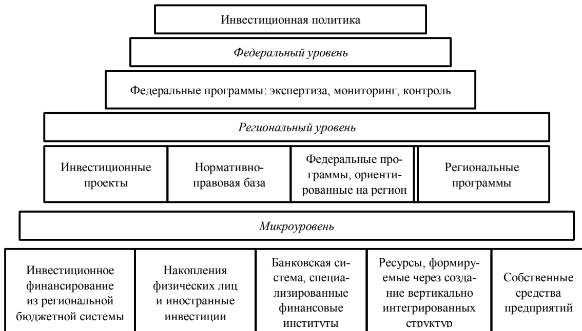
Рис. 2. Многоуровневая система инвестиционной политики в АПК

рантирования проектов, наращивания потенциала активов, создания механизма гарантирования на основе внебюджетных источников, гарантийно-залоговых фондов. Становление такой системы, по сути, единственный весомый инструмент прямого государственного воздействия на инвестиционные процессы, она поможет вовлечь в оборот инвестиционной сферы капитал банков. Вместе с этим инвестиционная политика должна проводиться в комплексе с другими антикризисными мероприятиями