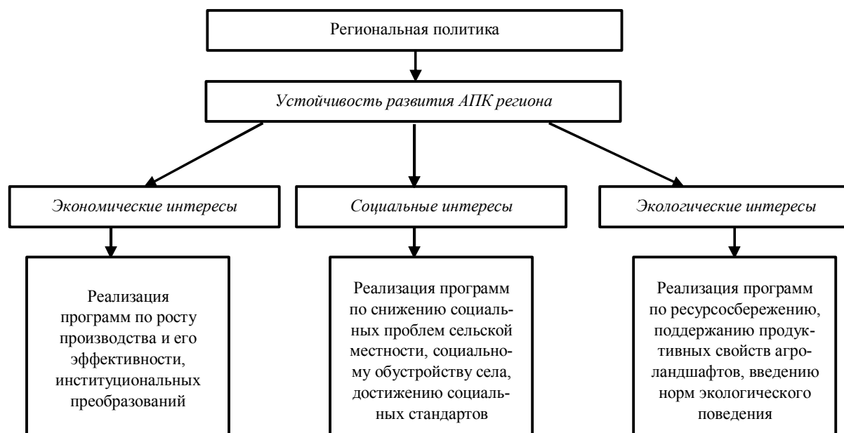
Рис. 1. Модель обеспечения устойчивости развития регионального АПК

ценовая, налоговая, внешнеэкономическая политика и др., прежде всего, ввиду самоочевидной обусловленности неблагоприятным положением дел в социальной, экономической и экологической подсистемах АПК, общерегиональной ситуацией. В связи с этим устойчивость развития агропромышленного комплекса региона является, скорее, объектом воздействия общих инструментов экономической политики и ее региональной составляющей. Поэтому универсальным инструментом реализации этих сопряженных общерегиональных целей и отраслевых целей региона служит инвестиционная политика. Дефицит ресурсов последней проявляется в неспособности их продуцировать в значимых объе-