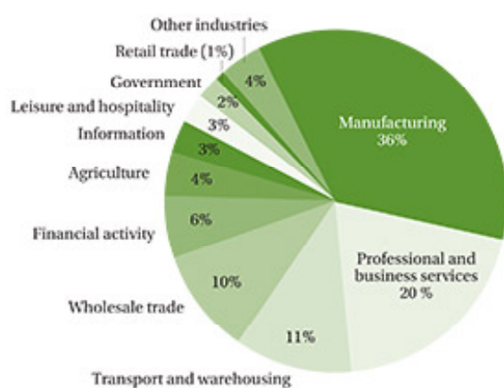
Рис. 1. Доля рабочих мест по ведущим отраслям промышленности США в 2008 г. за счет поддержки экспорта

Государственная поддержка может проявиться и в изменении доли (в сторону ее увеличения) средств, полученных за счет льготного кредитования, или в возмещении экспортерам (или импортерам, приобретающим национальную продукцию) части затрат на уплату процентов по кредиту.