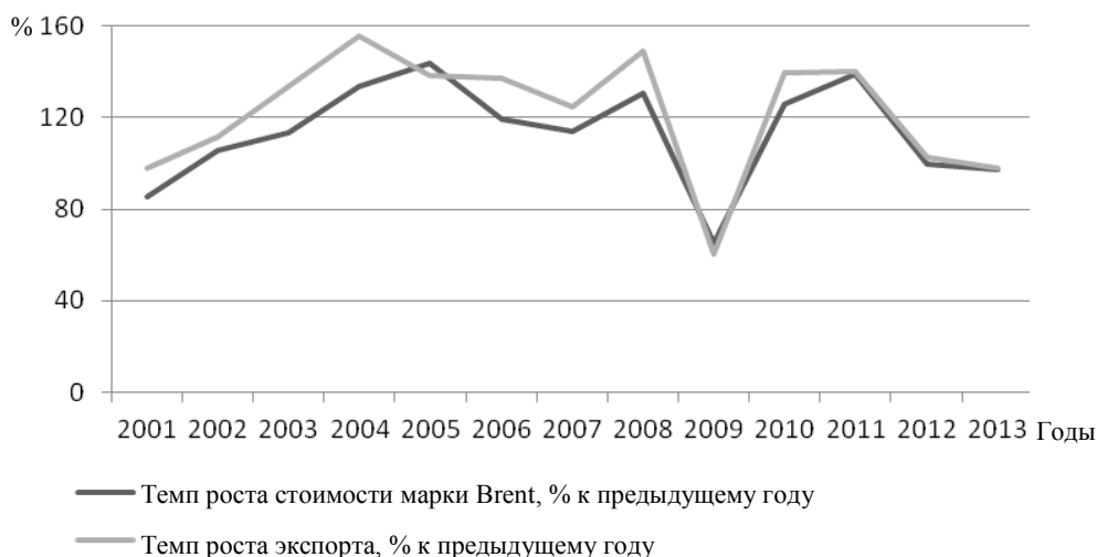
Рис. 1. Темп роста объема экспорта Республики Казахстан и цены на нефть, 2001-2013 гг.

В результате специализация экономики Республики Казахстан обусловлена экспортно-сырьевой направленностью. При этом, согласно результату корреляционно-регрессионного анализа, взаимосвязь темпа роста товарного экспорта страны с внешним фактором - ценой на нефть марки Brent составляет 85,2 % (рис. 1).