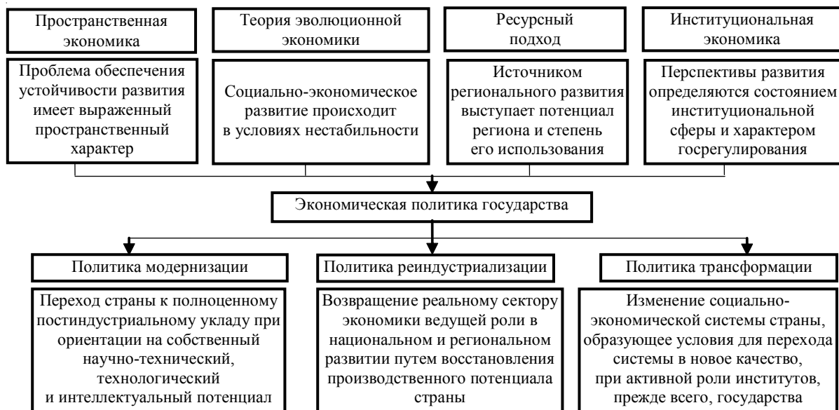
Рис. 2. Характеристика научной платформы исследований устойчивости социально-экономического развития регионов

Политика реиндустриализации - это действия по возвращению реальному сектору экономики ведущей роли в национальном и региональном развитии путем восстановления производственного потенциала страны. В настоящее время она актуальна не только для России, но и для высокоразвитых стран, в которых она реализуется в форме возвращения производств, ранее вывезенных в другие (менее развитые в экономическом плане) страны. В России политика реиндустриализации имеет совершенно иную природу: речь идет о необходимости воссоздания ранее утра-