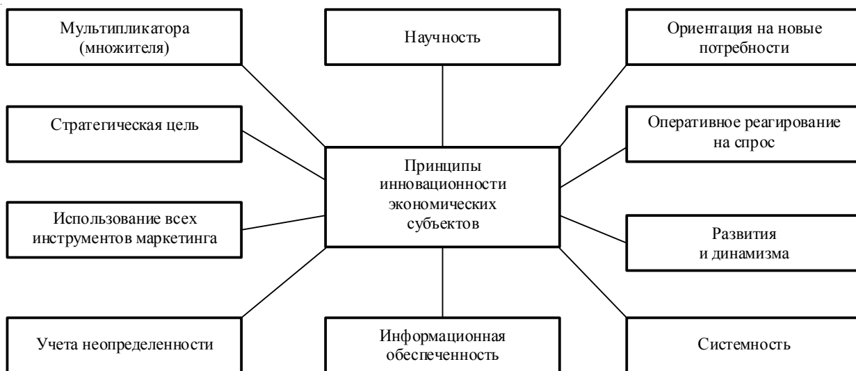
Рис. 2. Принципы инновационности