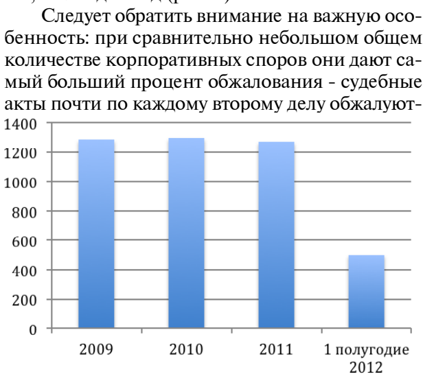
Рис. 1. Количество дел

В условиях мировой финансовой нестабильности недружественные захваты предприятий представляют значительную угрозу экономической безопасности России, что сказывается на сокращении производства, росте социальной напряженности, снижении инвестиционной привлекательности отечественной экономики и т.д. Их объектами зачастую становятся стратегические и социально значимые предприятия, научно-исследовательские и муниципальные учреждения, памятники истории, культуры и др. Также нельзя отрицать того факта, что иногда и само государство выступает в роли рейдера. Хотя российские масштабы рейдерских захватов до сих пор точно не подсчитаны, практически любой предприниматель в России живет под страхом рейдерского захвата. Если обратиться к статистике рассмотрения корпоративных споров в арбитражных судах за последние годы, то можно увидеть следующее. В 2009 г. было рассмотрено 1289 дел, в 2010-м - 1301, в 2011-м - 1276, а за 1-е полугодие 2012-го - 500, что на 27,5 % меньше, чем год назад (рис. 1).