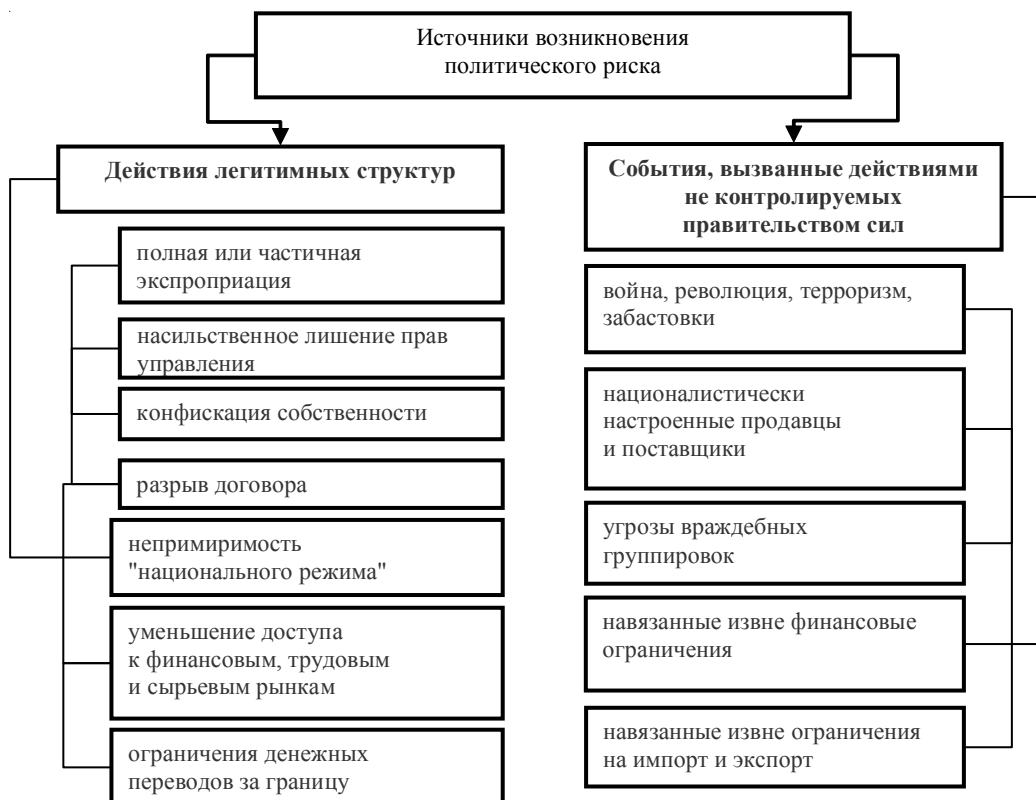
Рис. 2. Классификация политического риска ГЧП по источникам возникновения