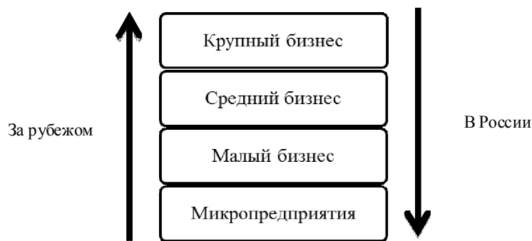
Рис. 1. Развитие экономической среды в России и за рубежом

В нашей же стране развитие малого бизнеса имело свои особенности, которые предопределили его нынешнее состояние. В России малый бизнес первоначально начал свое развитие в жесткой административно-монополевой системе. Исторически малый бизнес развивается значительно меньший временной период, в отличие от западного. В монополевой системе первоначально существовал только крупный бизнес с жесткими командными методами регулирования. Места для малого бизнеса первоначально попросту не было. Все экономические отношения были связаны только с крупными структурами. Сво-