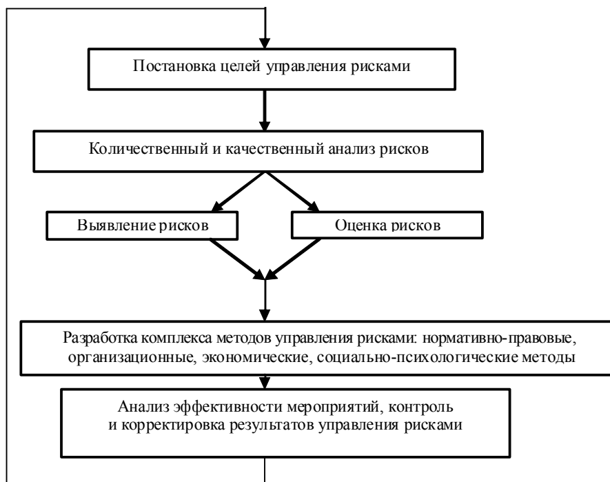
Рис. 2. Механизм управления рисками на предприятии

та или коммерческой сделки по уменьшению возможных убытков за счет снижения рисков для объекта (системы) с помощью финансовых инструментов, видов сделок, исполнения ролей и др. Фондовое страхование - это результат защитной функции рисков, нефондовое страхование - это порождение стимулирующей функции рисков. Фондовое страхование экономически более целесообразно, если мероприятия по предупреждению и снижению рисков недостаточно эффективны.