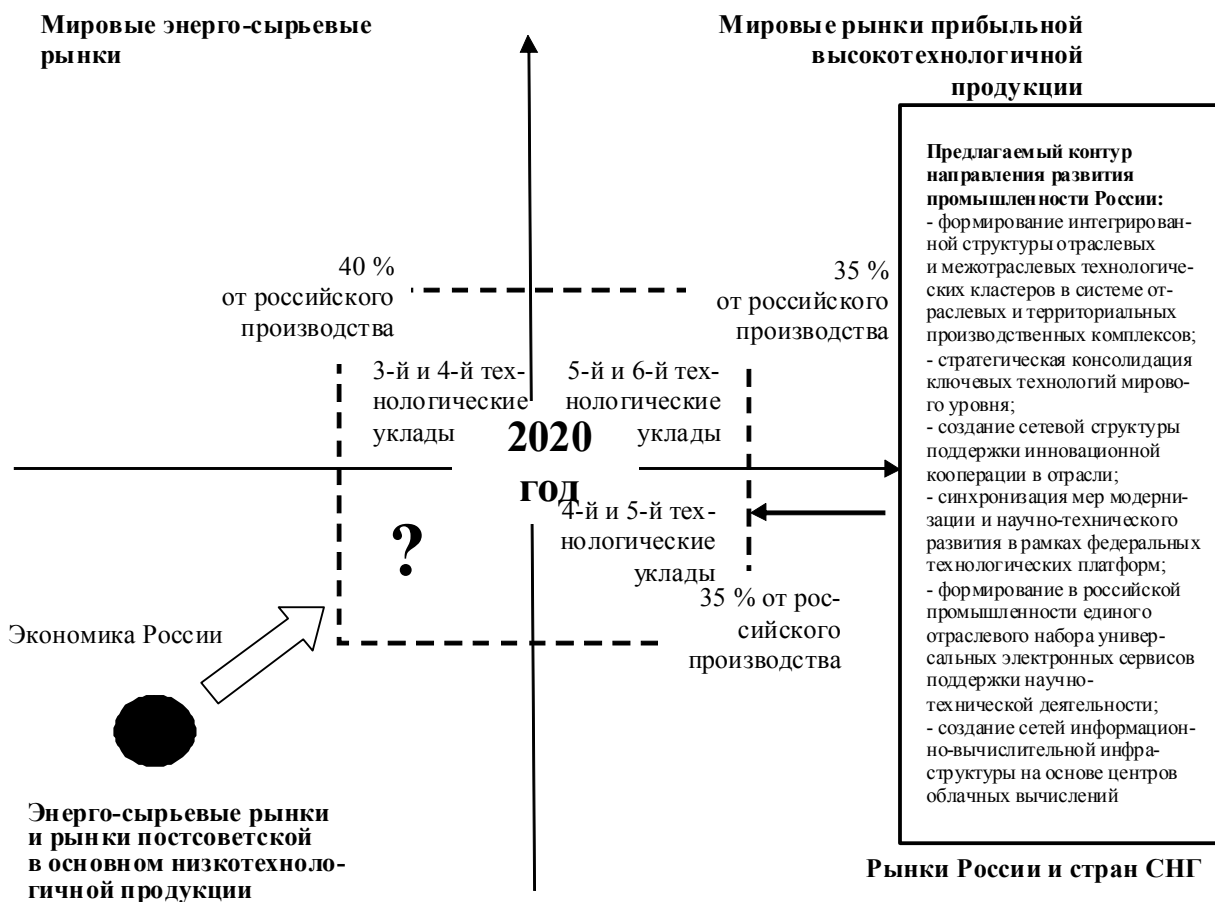
Рис. 2. Точка бифуркации: стратегический выбор направлений развития промышленности России

Интегральным результатом повышения эффективности использования факторов научно-технического развития для управления предприятиями является ускорение темпов модернизации всей российской промышленности, повышение динамики инновационных процессов, обеспечение синхронизации мер модернизации и научно-технического развития в рамках кооперации и, как следствие, существенное улучшение системного институционального взаимодействия в научно-технической сфере как предпри-