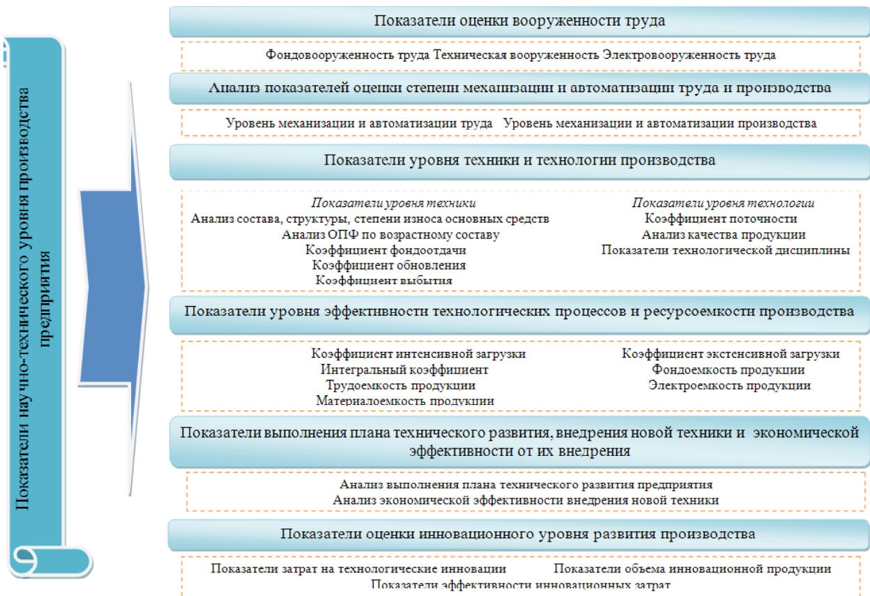
Рис. 4. Система показателей оценки научно-технического уровня производства