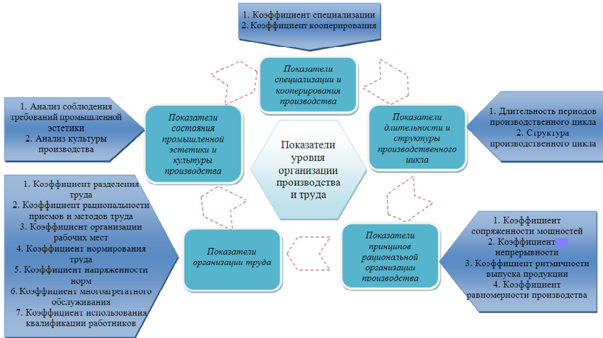
Рис. 3. Состав показателей уровня организации производства и труда