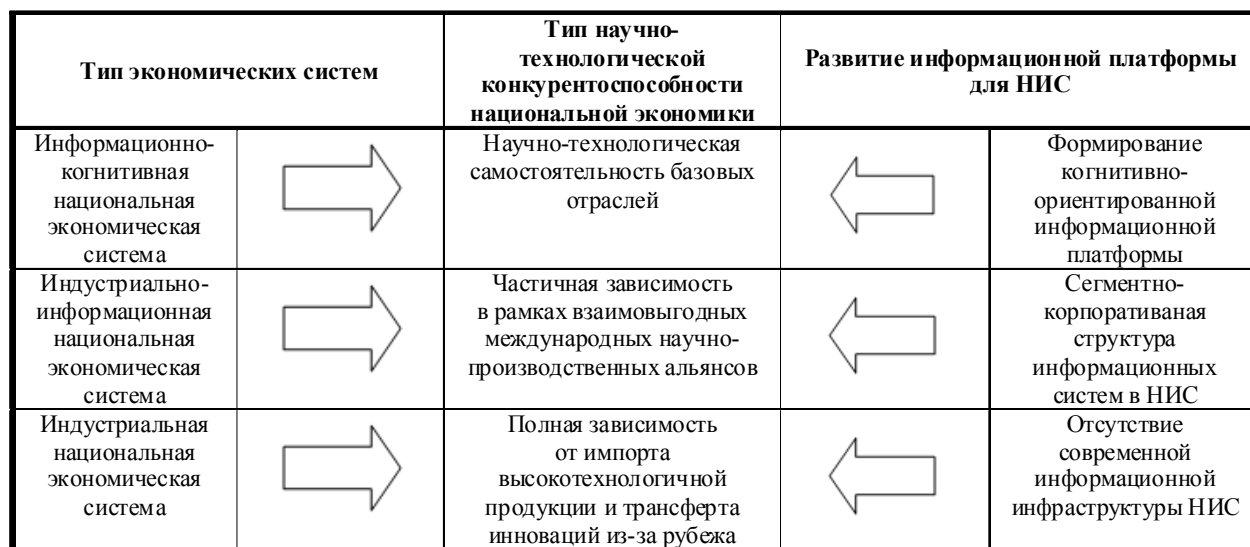
Рис. 3. Структурные взаимосвязи научно-технологической конкурентоспособности национальной экономики и развития информационной платформы для НИС

Как видно из рисунка, структурные взаимосвязи научно-технологической конкурентоспособности национальной экономики и развития информационной платформы для НИС показывают тесную взаимозависимость и взаимопоследовательность векторов развития экономических