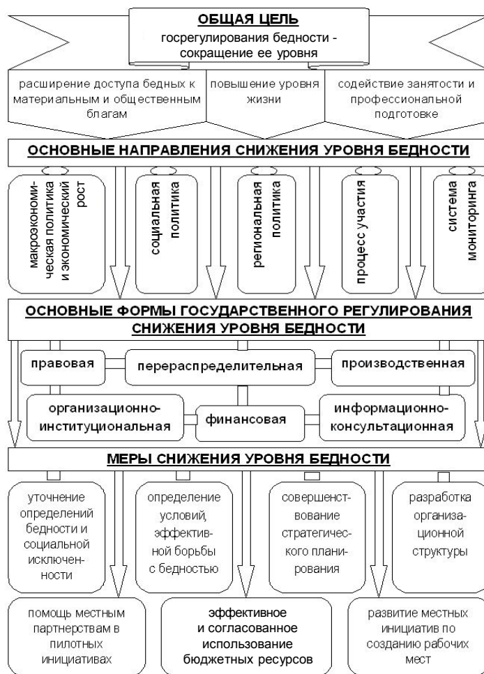
Рис. 2. Модель снижения уровня бедности в переходной экономике Российской Федерации и Республики Таджикистан

Как развитые страны, так и страны с новой переходной экономикой осуществляют меры по борьбе с бедностью населения. Государственная политика сокращения уровня бедности зависит, прежде всего, от достигнутого уровня социально-экономического развития страны и степени неравенства в распределении ресурсов. Правительство РФ и “новых европейских” стран связывают стратегии, направленные против бедности, с общими планами развития (например, делая акцент на