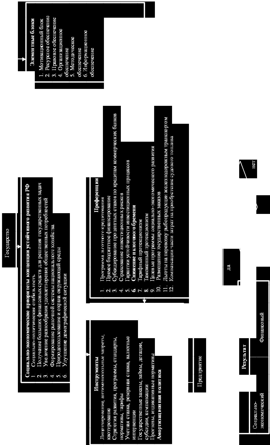
Рис. 2. Схема экономического механизма, обеспечивающего устойчивость развития рыночных предприятий, основанного на государственном регулировании