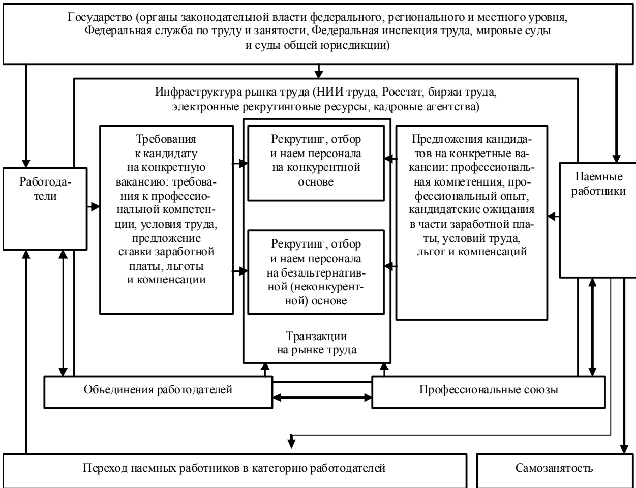
Рис. 1. Структура рынка трудовых ресурсов, учитывающая реализацию принципа конкуренции при организации социально-трудовых отношений

Не менее важным элементом рынка трудовых ресурсов является инфраструктура, призванная обеспечить его непосредственное функционирование, а также определяющая результативность и эффективность процессов, идущих в его пределах. К основным представителям инфраструктуры отечественного рынка трудовых ресурсов относятся: НИИТруда - научная база мониторинга, анализа, оценки и управления процессами развития рынка трудовых ресурсов, Росстат - обеспечение статистической информации о состоянии и динамике рынка труда, биржи труда, электронные рекрутинговые ресурсы, кадровые агентства - эти субъекты непосредственно обеспечивают взаимодействие работодателей и наемных работников.