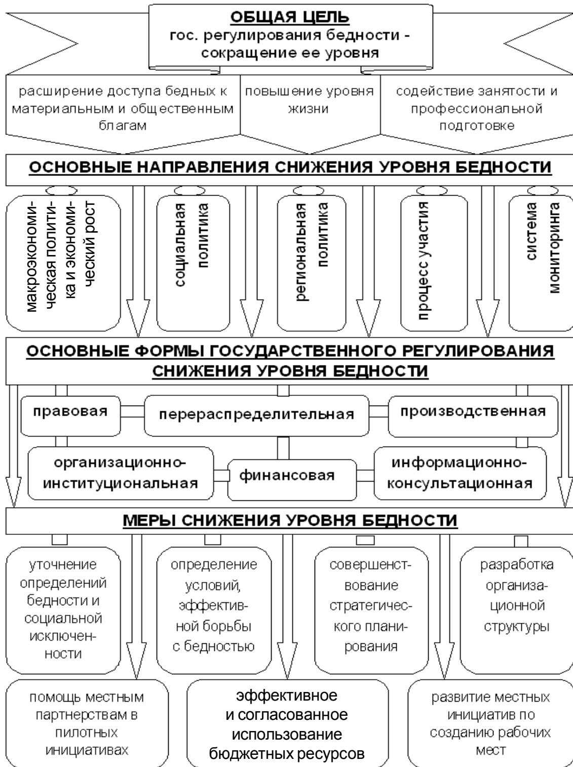
Рис. 2. Модель снижения уровня бедности в переходной экономике Российской Федерации и Республики Таджикистан