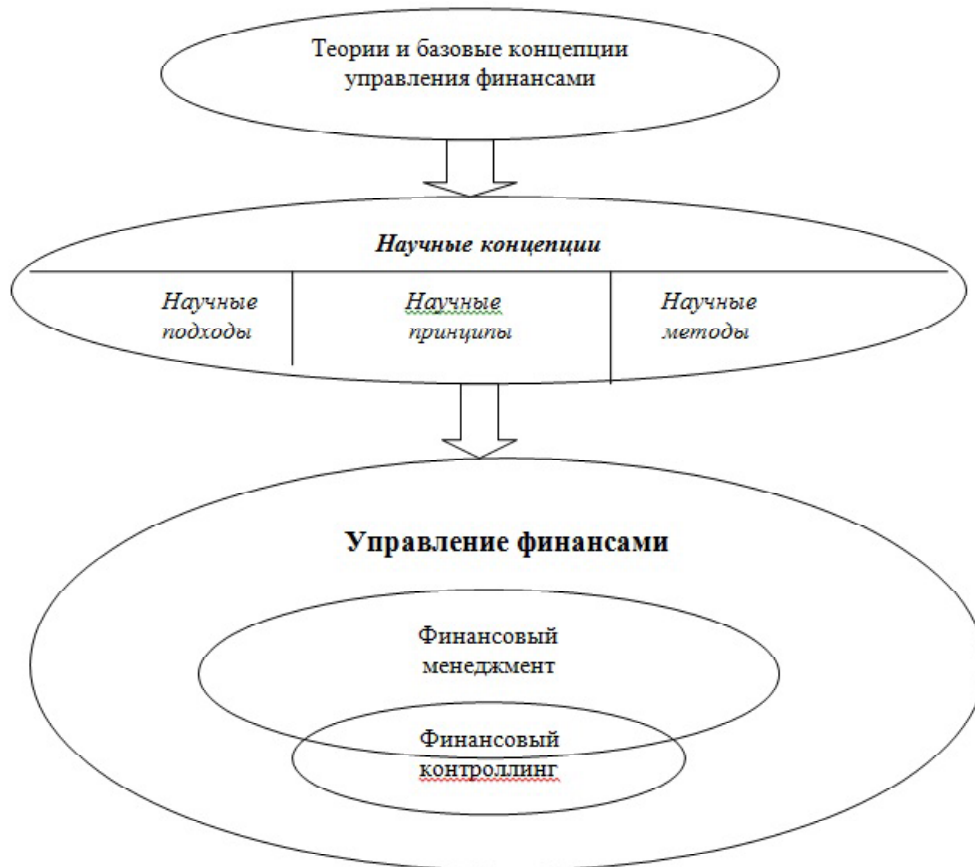
Рис. 2. Причинно-следственная модель взаимодействия управления финансами, финансового менеджмента и финансового контроллинга

ких условиях экономический рост затруднителен. Все это требует формирования новых эффективных подходов к управлению компаниями в так называемых условиях "новой антикризисной экономики", способных мобильно выявлять негативные тенденции и мобильно адаптироваться к экономическим и рыночным изменениям.