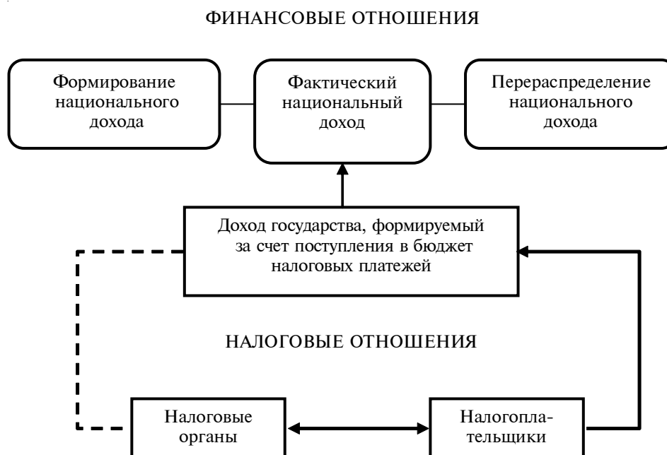
Рис. 1. Место налоговых отношений в системе финансовых отношений

Налоговые отношения - это часть финансовых отношений, которые складываются в обществе при перераспределении созданной стоимости и формировании доходной части бюджета государства в части всех видов налогов и сборов. Налоговые отношения носят многоаспектный и комплексный характер вследствие многообразия форм и видов налогов, с одной стороны, и сложности форм и методов налогового администрирования, обеспечивающих поступление налогов в бюджет, - с другой. Налоговые отношения, возникающие в процессе уплаты налога, имеют так называемую “материальную основу”, поэтому объектом налоговых отношений в данном случае можно назвать движение стоимости на этапе ее перераспределения. Движение стоимости при