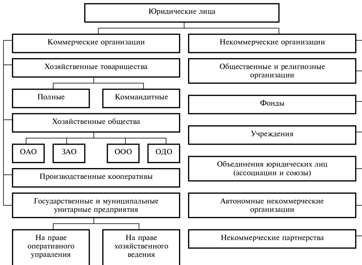
Рис. 1. Основные организационно-правовые формы предпринимательской деятельности

Источник. Когденко В.Г., Мельник М.В., Быковников И.Л. Краткосрочная и долгосрочная финансовая политика. М., 2010.