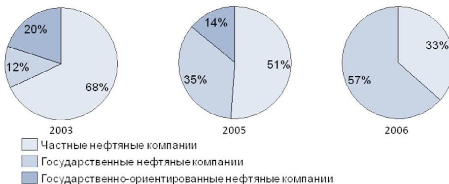
Рис. 1. Доли нефтяных компаний в РФ по типам (2003-2006)

Отметим, что в структуре сделок в нефтегазовом секторе в 2007 г. продолжали, однако, пре-