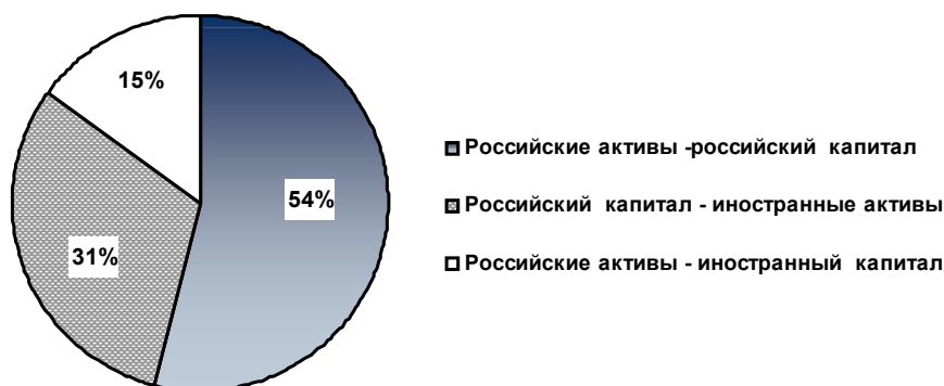
Рис. 3. Соотношение сделок inbound и outbound в нефтегазовом секторе в 2008 г.