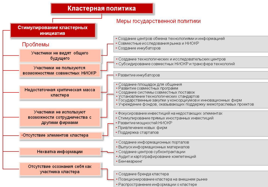
Рис. 1. Меры государственной кластерной политики, направленные на решение проблем кластерной динамики и стимулирование кластерных инициатив

С целью преодоления подобных ограничений государство может применять различные меры направленного воздействия, включая организацию площадок для коммуникации и обмена опытом участников, развитие системы госзакупок и условий для новых фирм на пространстве образующегося кластера, стимулирование создания старт-апов, привлечение прямых иностранных инвестиций, субсидирование совместных научных разработок, формирование мощностей НИОКР и информационных порталов, выпуск информационных материалов для участников кластера и др. Более полный перечень мер государственного воздействия на отдельные элементы кластера и процессы кластеризации представлен на рис. 1.