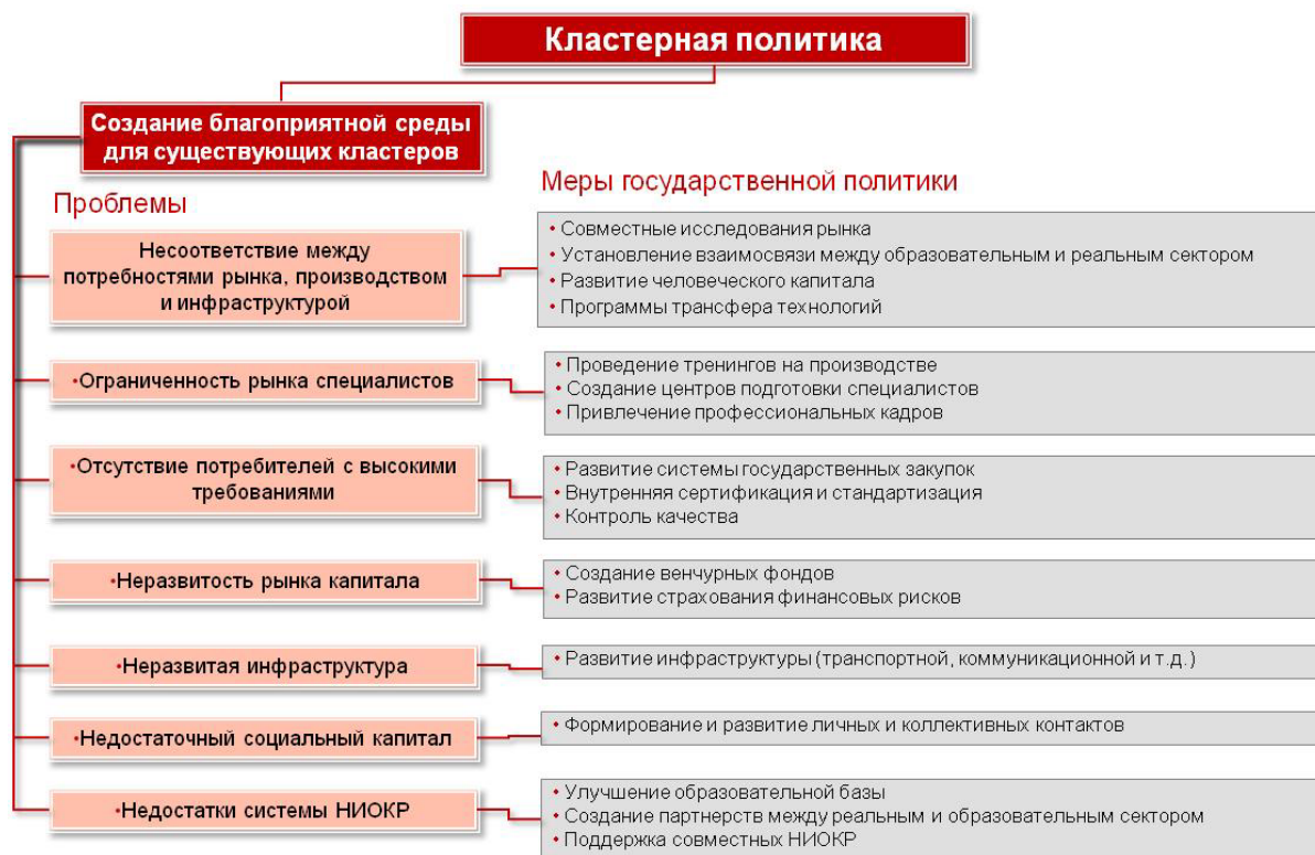
Рис. 2. Меры государственной кластерной политики, направленные на создание благоприятной среды формирования и развития кластеров

Таким образом, на основании рассмотренной феноменологии кластера как естественного продукта рыночных экономических отношений закономерно формируется вывод о том, что роль