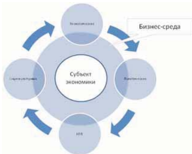
Рис. 1. Бизнес-среда субъекта экономики и факторы перманентного влияния внешней среды

Урбанизация и миграция народонаселения, обеспечивающие потоки мигрантов из бедных