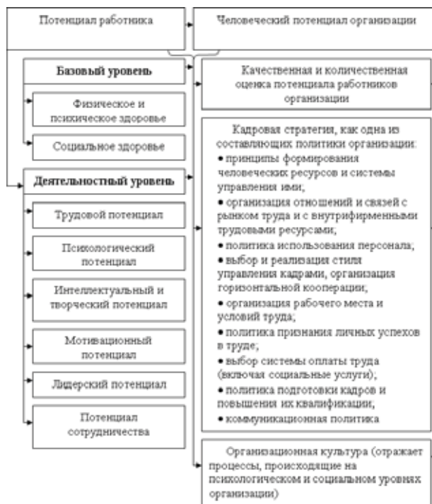
Рис. 2. Элементы человеческого потенциала организации

Источник. Нижегородцев Р.М., Резник С.Д. Человеческий капитал: теория и практика управления в социально-экономических системах: монография. М., 2008. С. 32.