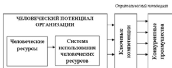
Рис. 1. Взаимосвязь человеческого потенциала и конкурентных преимуществ

Источник. Нижегородцев Р.М., Резник С.Д. Человеческий капитал: теория и практика управления в социально-экономических системах: монография. М., 2008. С. 32.