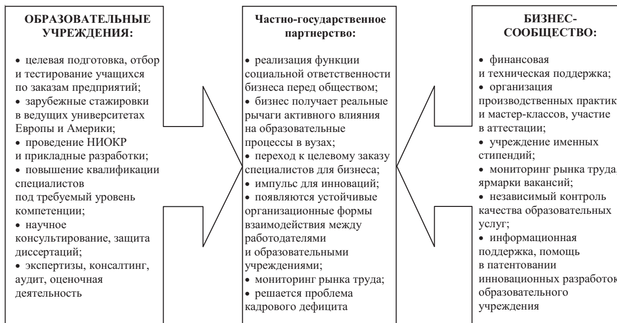
Рис. 1. Реализация частно-государственного партнерства по развитию системы образования Республики Татарстан

Поскольку доходы от эндаумента идут только на цели образования и срок их действия ог-