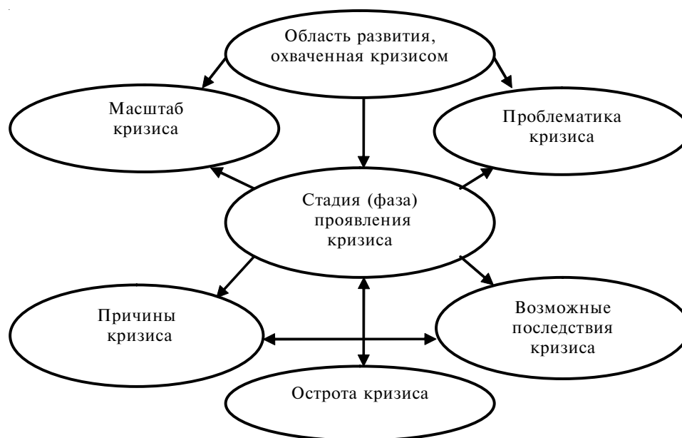
Рис. 1. Классификационные признаки кризиса

Благодаря системе страхования вкладов и различным формам явных и неявных гарантий