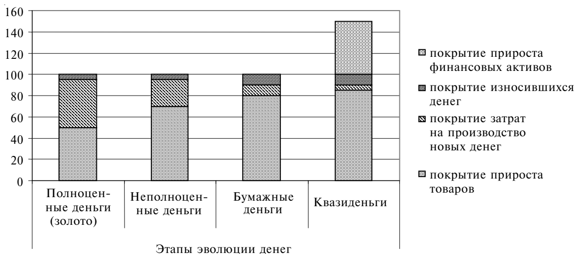
Рис. 1. Структура выпуска денег на различных этапах эволюции

Эволюция денег сопровождалась значительным изменением в пропорциях между приростом различных составляющих дополнительно эмитированных денег в экономике. С течением времени все большая доля денежной массы обслуживает движение финансовых активов. Представим изменение в пропорциях прироста различных составляющих дополнительно эмитированных в экономику денег (рис. 1 и 2).