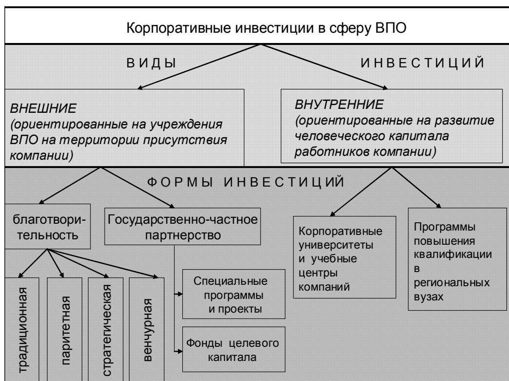
Рис. 3. Виды и формы корпоративных инвестиций в сферу ВПО

циональных причин, это также связано с так называемым “оппортунизмом работодателей” 5 , берущим свое начало в советской системе. Как известно, размещение промышленного производства во многих регионах в условиях командной экономики предполагает доминирование крупных промышленных предприятий. В сочетании с сохраняющейся низкой межрегиональной мобильностью рабочей силы и слабым развитием малого бизнеса на сегодняшний день это дает крупным предприятиям монополистическую власть над работниками; на рынке труда им легче найти уже обученного специалиста, чем в течение ряда лет инвестировать средства в его подготовку. Таким образом, работодатели получают возможность присваивать значительную часть ренты, не производя инвестиций в сферу ВПО, а рассматриваемую ситуацию можно в целом описать с помощью известного в теории эффекта наездника (free rider problem), когда один агент хочет “прокатиться” за счет других.