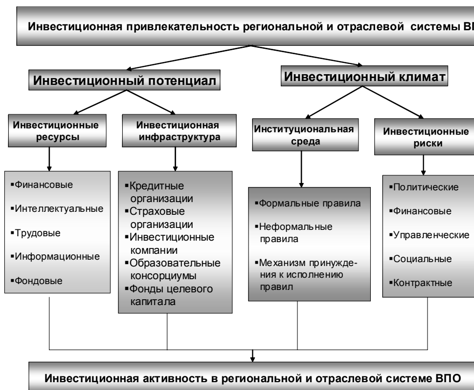
Рис. 4. Факторы, обеспечивающие преобразование инвестиционной привлекательности сферы ВПО в инвестиционную активность

деления инвестиций, защищенные от манипулирования, или механизмы честной игры (открытого управления неманипулируемыми механизмами).