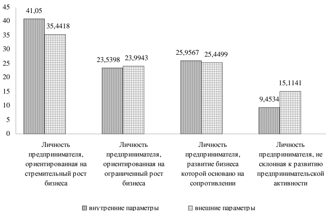
Рис. 3. Сравнительный вклад внутренних и внешних параметров в процесс формирования личности предпринимателя