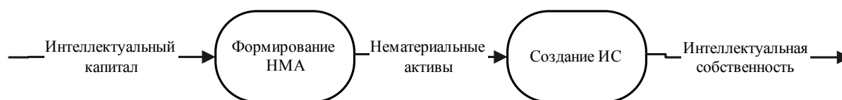
Рис. 1. Преобразование интеллектуального капитала

В рамках сформулированных положений автор статьи поднимает вопрос о необходимости эффективного управления собственностью Союзного государства на базе ранних индикаторов и прогноза рисков. Теоретические основы собственности определяют имущественные права на интеллектуальную собственность как результат наличия нематериальных активов. В свою очередь, нематериальные активы являются конечной формой функционирования интеллектуального капитала (ИК) организаций Союзного государства (рис. 1).