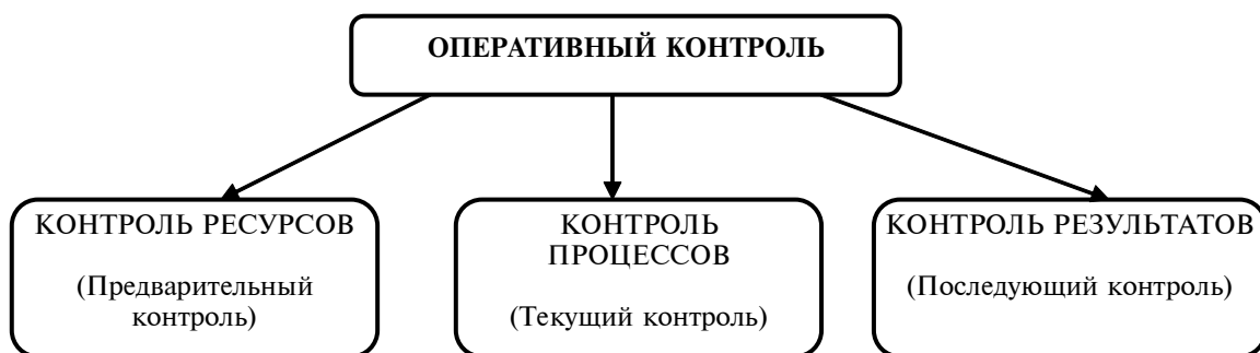
Рис. 2. Формы оперативного контроля

Рассмотрим основные структурные компоненты организации оперативного учета и контроля.