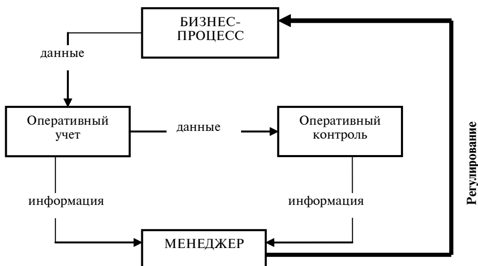
Рис. 1. Оперативный учет и контроль в системе оперативного управления

Функции оперативного учета и контроля выполняют роль обратной связи в процессе управления деятельностью хозяйствующих субъектов (рис.1).