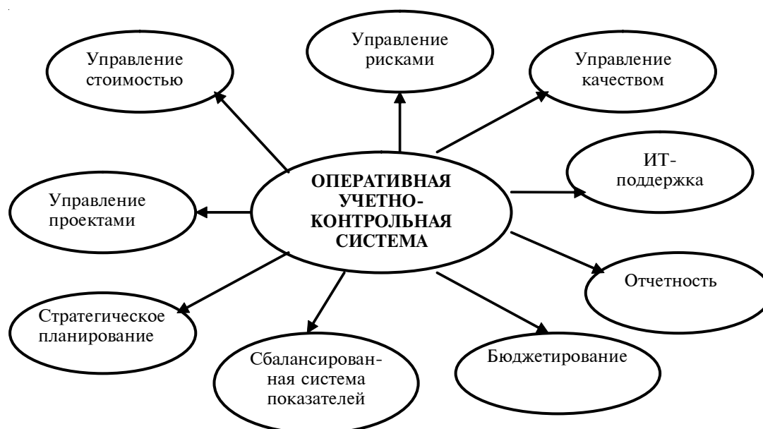
Рис. 4. Интеграция оперативной учетно-контрольной системы в системы управления

но все возникает на каком-нибудь основании и в силу необходимости”.