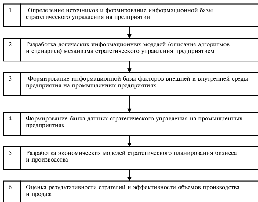
Рис. 1. Технологическая схема формирования информационной базы стратегического управления предприятием

Представим подход к логической последовательности формирования информационной базы в условиях стратегического управления на предприятиях (рис. 1).